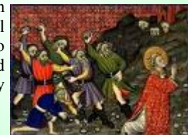
12/26 - Feast of St. Stephen, first martyr.

(You may recognize the image of St. John Cantius above one of the confessionals. St. John Cantius, who felt sorrow for the poor girl who dropped a jar of milk, asked her to pray with him to God...the jar was restored and filled with water, which immediately turned into milk.)